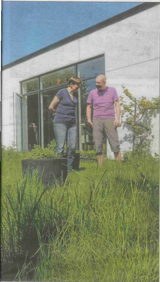
Det grønne får lov til at vokse vildt hos parret, der tænker grønnere end de fleste.

nu er formand for, er tænkt som et arbejdende værksted og videnscenter.