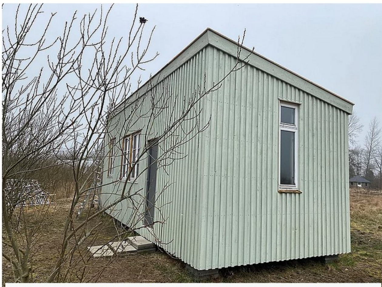
Områdets første tiny house blev bygget med fælles indsats på en workshop. Huset er beregnet til en person og mindre end de 43 m 2 , som parrets hus skal være.

- Vi er gået fra at være klimatosser til at være entusiastiske klimaforkæmpere i den sidste artikel i lokalavisen. Det kan vi bedre identificere os med, smiler Helga König-Jacobsen.